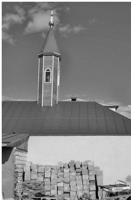
В самую крупную в исправительных колониях Татарстана мусульманскую общину ИК-5, расположенную в Зеленодольском районе Татарстана, сегодня входит 125 осужденных.

Дневную молитву в мечети свияжского учреждения могут посещать около 50 человек - остальные заняты на производстве. Но и в промышленной зоне "пятерки" также имеются условия для молитвы. В этом году для мусульман в учреждении были созданы условия и для соблюдения поста Рамадана (уразы). Духовное управление мусульман Республики Татарстан