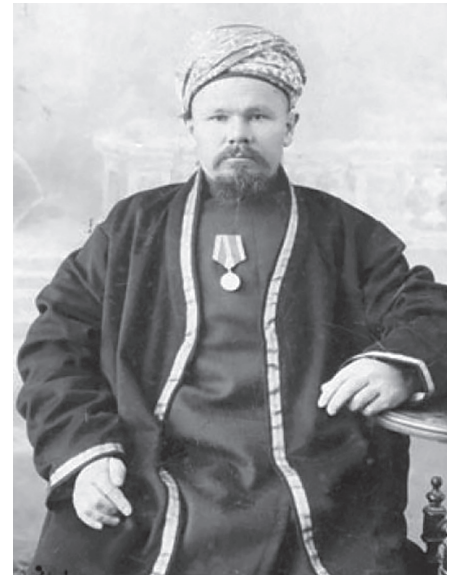
Әхмәдзәки хәзрәт Әхтәмов.

1891 елдан Әхмәдзәки Әхтәмов Зәйсәндә дини вазифаларны башкарган: 1891–1895 елларда жирле хәрби мөселманнар арасында имам,