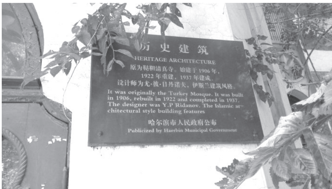
Мәчет бинасындагы язу тактасы

яшәгәнлектән, бөтен нәрсә, шул исәптән төзелә торган мәчет тә зыян күрә.