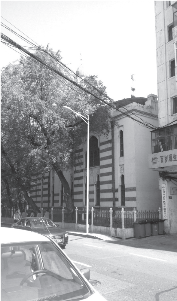
Харбин мәчете

Ислам динен кабул итүнең 1100 еллыгы хөрмәтенә төзелгәнгә күрә, халыкта аны «меңъеллык мәчете» дип атый башлаганнар.