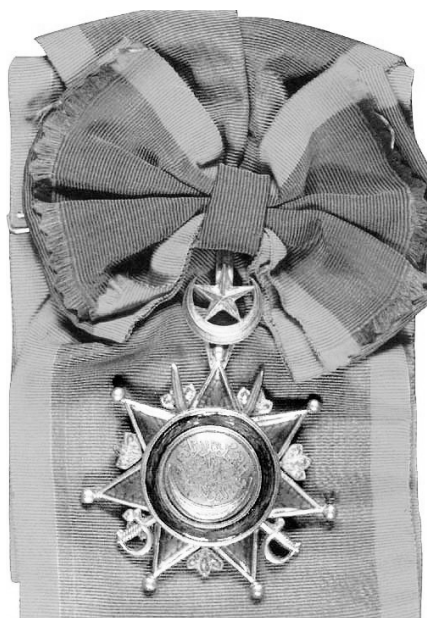
1 нче дәрәжәдәге Госмания ордены лентасы

Ике ай чамасы Нургали хэзрэт төрек патшасының сараенда яши һәм солтан тарафыннан игътибарга һәм мактауга лаек була. Бу вакыйга Рамазан аена туры килә. Нургали хэзрэт солтан Габделхәмид IIгә бик нык якыная, хәтта алар бергәләп ифтар кылалар, тәравих намазларын укыйлар. Сарайдагы тәртип, әдәп буенча, хэзрэт солтан белән очрашкач, аның кулын үбә торган була. Хәтта алар берьюлы дусларча кочаклашалар да.