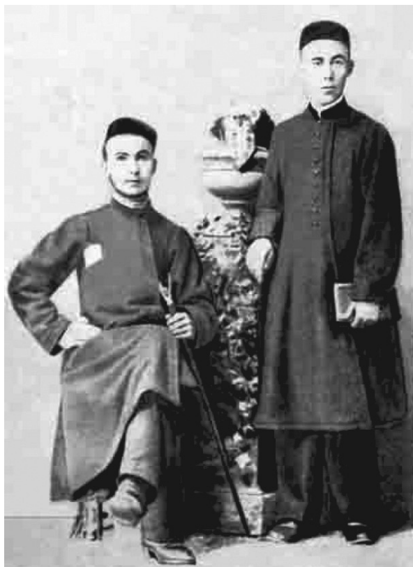
«Нурия» мәдрәсәсе шәкертләре

Нургали Хәсән улы Әл-Буави 1919 елның 19 нчы маенда бу фани