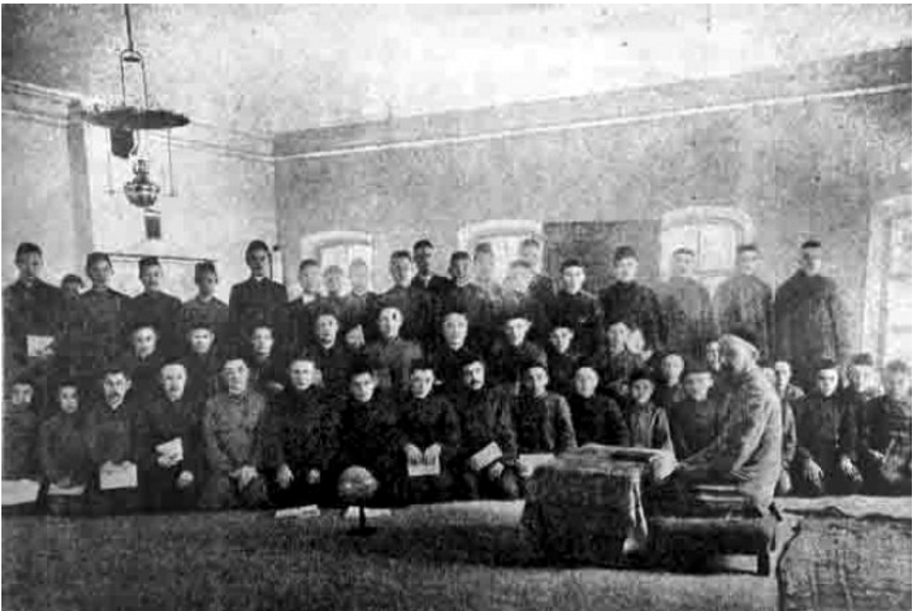
«Нурия» мәдрәсәсе укытучылары һәм шәкертләре. Буа шәһәре. XX гасыр башы.