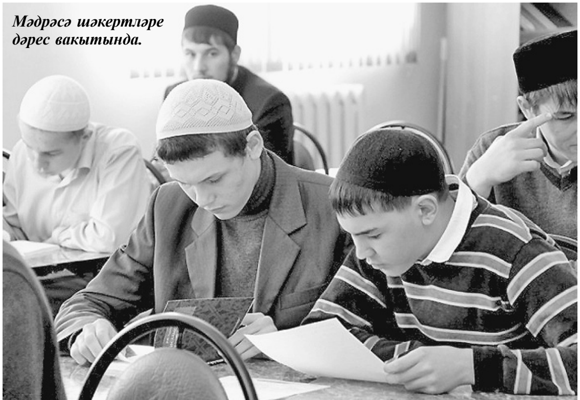
Мәдрәсә шәкертләре дәрес вакытында.

Р. Фәхрәддиннең "Тәрбиялә ана" исемле китабын укып чыккач, кызлар бер фикер айтте: бу китапны без ир-ат язган дип уйламас идек, әгәр дә язучысы Р. Фәхрәддин булмаса, диделәр. Бу шәхес мәсьәләгә никадәр психологик якын килгән!