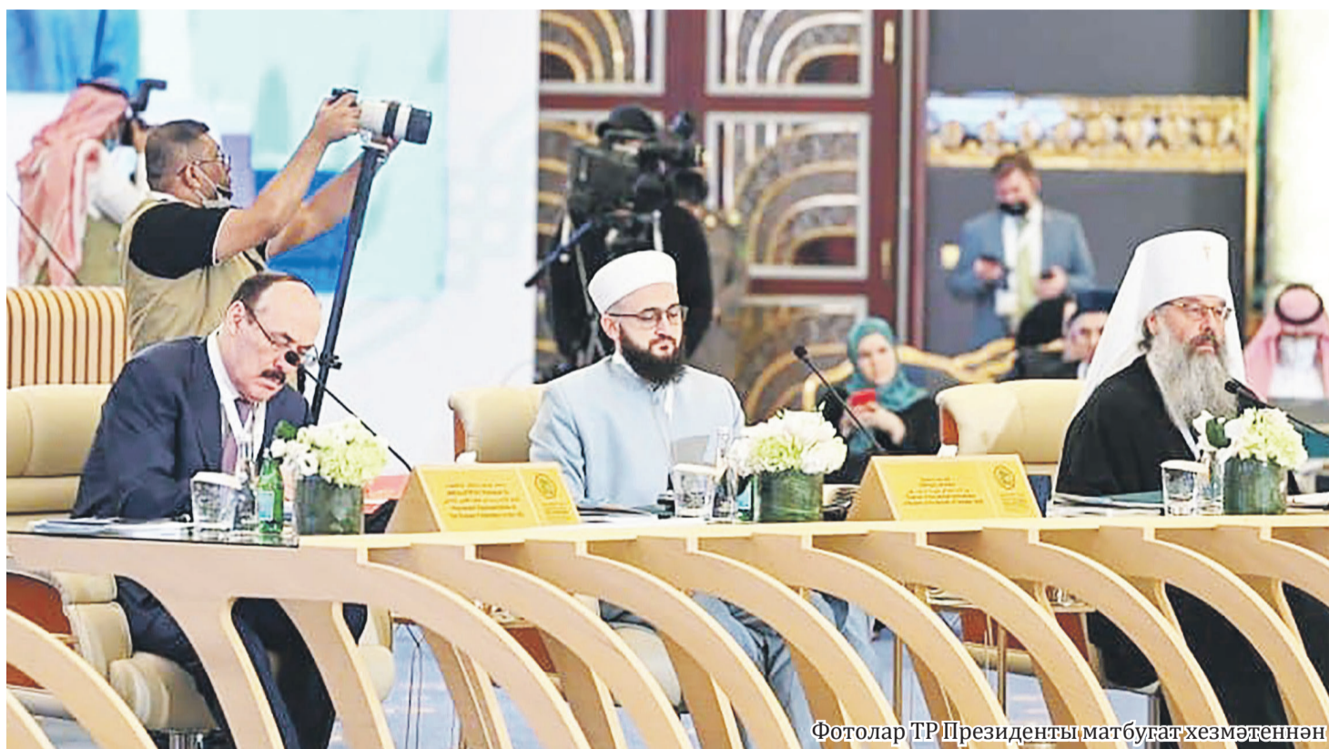
Фотолар ТР Президенты матбуғат хезмәтеннән

нигезендә Коръән басмага эзерләнгән. "Казан басма" исемле дизайнлы компьютер шрифты дөньякүләм танылган иске типографик оттискысы нигезендә ясалды. Шрифт Коръән мөсхәфләрен бастыруга яңа зур мөмкинлекләр ачачак, Коръән һәм китаплар бастыруның татар традицияләрен яңартуға һәм үстерүгә ярдәм итәчәк.