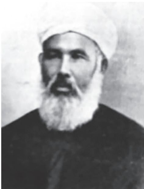
● Габдерәшит Ибраһимов (1857-1944).

Габдерәшит Ибраһимов XIX гасыр ахыры – XX гасырның беренче яртысында Рәсәйдә яшәгән иң күренекле мөселман эшлеклеләренең берсе була. Ул үзенең киң эшчәнлек алып баруы һәм сәяхәт кылулары белән, Рәсәйдә генә түгел, бөтен мөселман дөньясында таныла. Габдерәшит Ибраһимов Уфадагы Ырынбур мөселман Диния нәзарәтендә казый вазифасын башкарганга күрә, мөселманнар арасында Габдерәшит казый буларак билгеле.