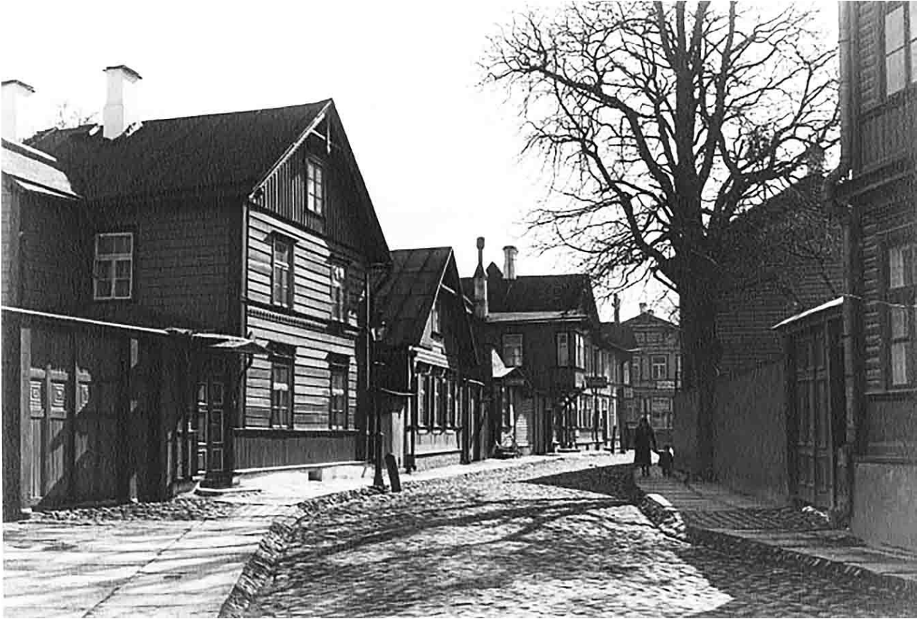
Таллиндагы татар урамы

Алдагы теманы дәвам иттереп, мәкалә XIX гасырда Эстониядәге татарлар тормышын яктыртуга багышлана.