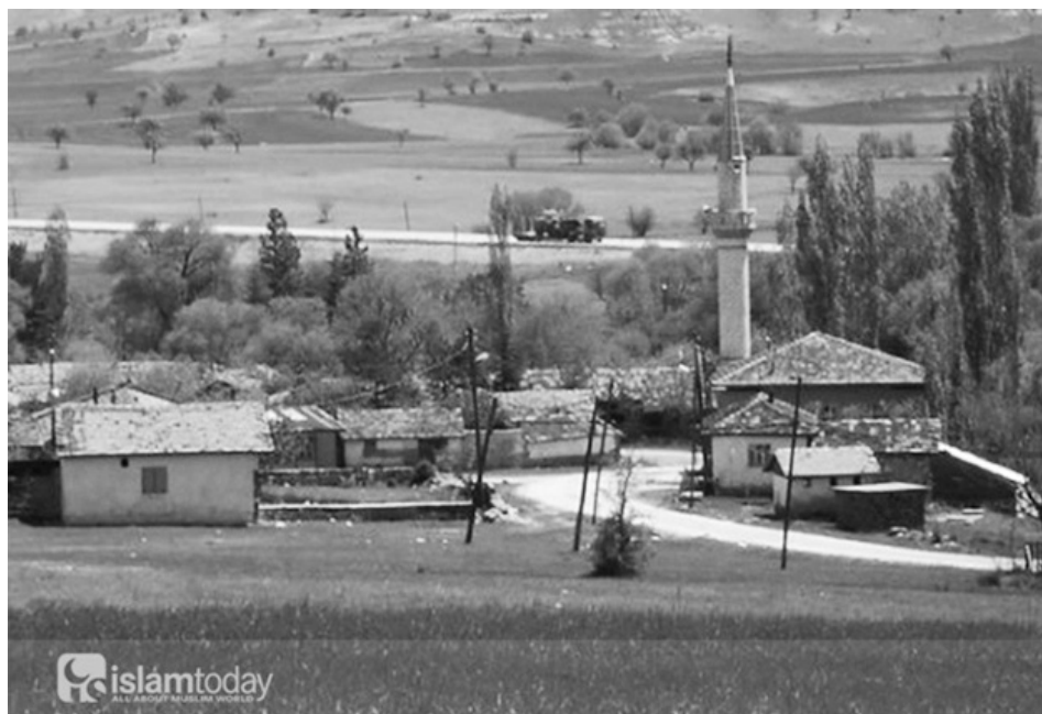
Төркиядә татар авылының барлыкка килү тарихы